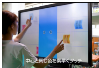
中心と同じ色を素早くタッチ