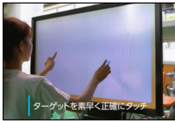
ターゲットを素早く正確にタッチ