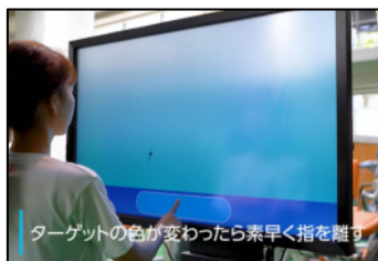
ターゲットの色が変わったら素早く指を離す