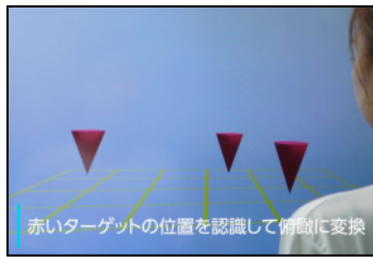
赤いターゲットの位置を認識して俯瞰に変換