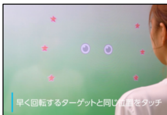
早く回転するターゲットと同じ位置をタッチ